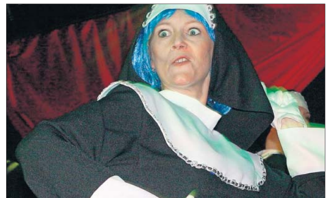
„Die Nonnen kommen“, warnte die Gaudigarde.

Rouge einen Can-Can zelebrierte, bei dem den Gästen vor Begeisterung die Augen tropften. Die Juniorengarde suchte anschließend „Das Supertalent“ und im letzten Schautanz stürmte nochmals die Stadtgarde mit dem fetzigen Showtanz „Der Widerspenstigen Zähmung“ die Bühne.