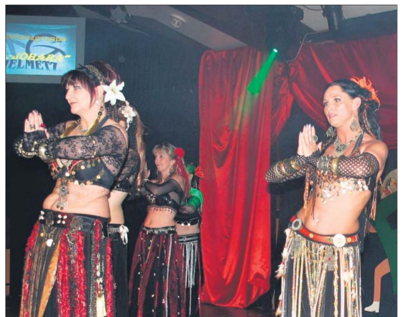
Die Bauchtanzgruppe „Al Johara“ entführte in den Orient.