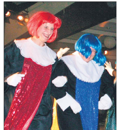
Die Nonnen können tanzen und feiern.