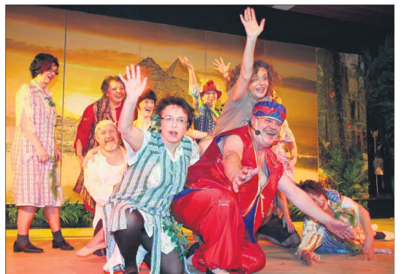
Das Schubberballett tauchte urplötzlich mit einem Flaschengeist wieder auf.

Mit Rathausstürmen und Prunksitzungen hat am Wochenende die fünfte Jahreszeit begonnen. In Hof, Rehau, Lippertsgrün und Helmbrechts feierten die Narren. Auf dieser Seite haben wir einige Bilder von lustigen Kostümen und furiosen Tanzeinlagen gesammelt. Noch mehr gibt es natürlich unter www.frankenpost.de .