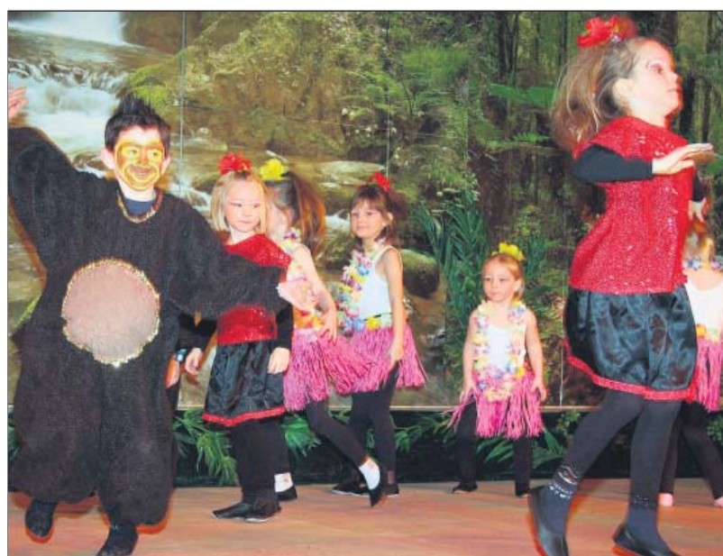
Die Purzelgarde begeisterte mit ihrem Tanz „Gorilla mit der Sonnenbrille“.