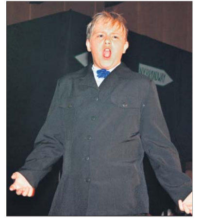
Die Suche nach dem „Supertalent“.