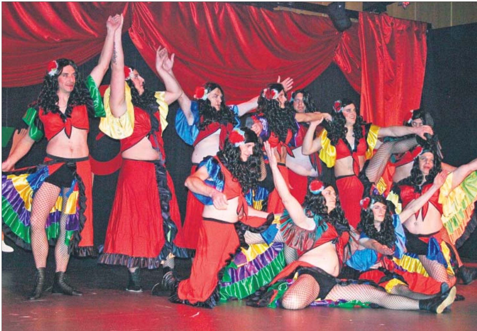
Das Helmbrechtser Männerballett entführte ins Moulin Rouge.